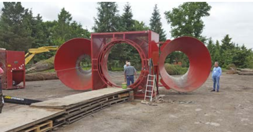
Snørremaskinen på læssepladsen ved Woods Farm med de to indsats til reduktion af tragtstørrelsen