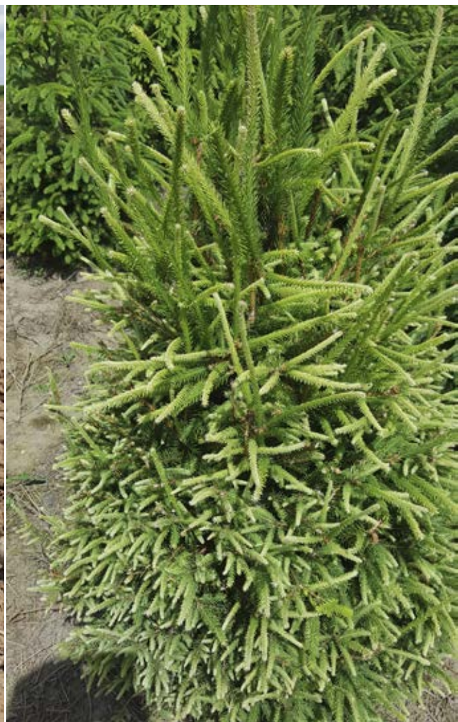
Svær og stiv jord i kombination med tørke besværliggjorde kulturarbejdet på Freizeland Christmas Tree Farm (tv). Omfattende Roundup-skader på rødgran (th) – producenten hævdede, at årsagen var forårets tørke.