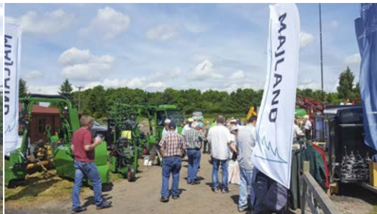
Mindre leverandørudstilling på Freizeland Christmas Tree farm med et betydeligt dansk islæt.

afgang af nyetableret rødgran i pletter fra en anden leverandør, hvilket blev henført til et meget tørt forår. Også omfattende skader efter Roundup ved et følgende punkt blev henført til den tørre periode efter sprøjtningen!