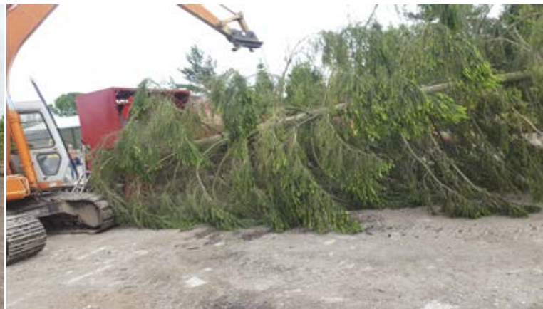
Et stort juletræ på 20 meter og 1.500 kg gøres klar til netning.

Torsdag var også en feltdag, og denne gang besøgte vi Cadeby Tree Trust ved Nuneaton, som er Midtenglands største producent med knapt 300 ha juletræer. Firmaet begyndte at sælge juletræer tilbage i begyndelsen af 1980'erne og startede selvproduktion i midten af 1990'erne. I dag plantes årligt 150.000 træer; 45 % nordmannsgran, 25 % rødgran, 10 % frasergran, 5 % blågran og 15 % pottede træer med de fire arter. Bortset fra et mindre detailsalg sælges alle træer til grossister, og man markedsfører sig på stor fleksibilitet og levering af selv små