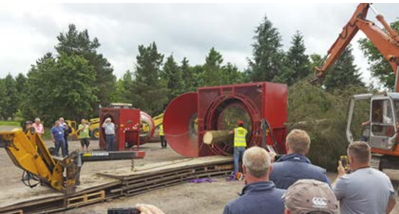
Træet trækkes igen med læssemaskinen, mens rende-graveren løfter/holder træet.