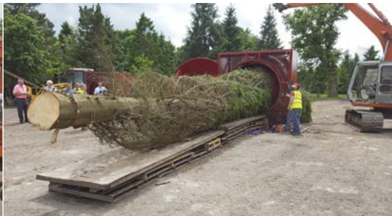
Træet næsten færdigsnorret. Pris ab farm 7-8.000 £ (ca. 45 kr./kg).

mannsgran og rødgran. Først så vi en yderst renholdt nyplanti- ning - behandlingen bestod i 3 l Roundup + 3 l MCPA pr. ha! Denne behandling er ikke lovlig i Danmark. Siden så vi ældre træer, hvor man arbejdede med top- og formregulering af træerne. Det var en meget professionel produktion med fokus på produktion af træer i en god kvalitet. Form- og topregule- ring blev dog ikke gennemført helt så systematisk, som det ses mange steder i Danmark, men indsatsen baserede sig mere på behandlingsbehovet for det enkelte træ. Dette gav selvsagt