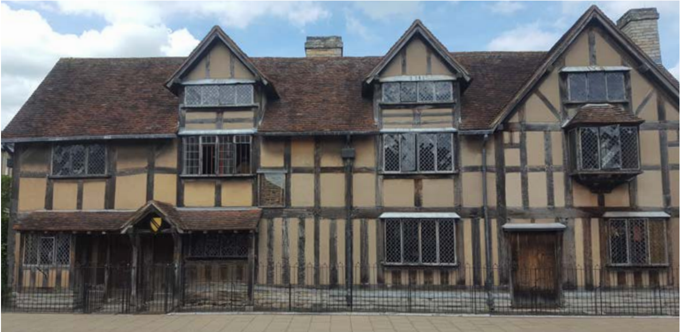
William Shakespeares fødested.