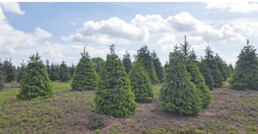
Store formhuggede rødgran på Cadeby Tree Trust – mange englændere foretrækker disse tætte træer.