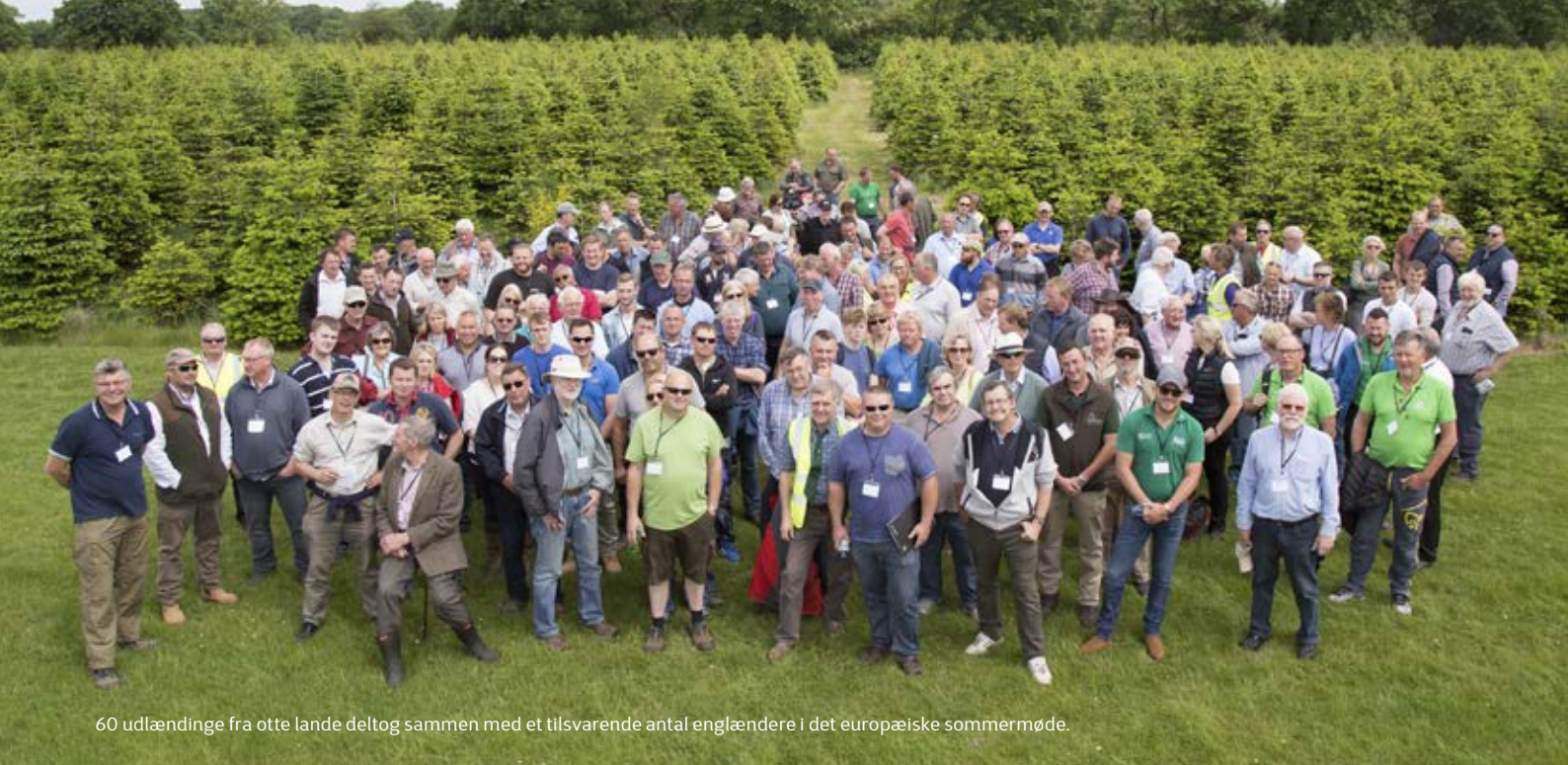
60 udlændinge fra otte lande deltog sammen med et tilsvarende antal englændere i det europæiske sommermøde.