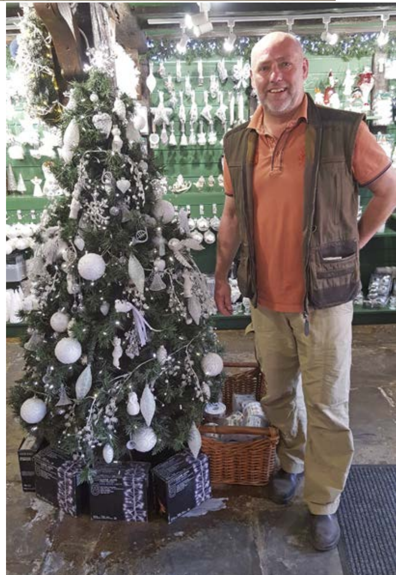
I Shakespeares fødeby var der også en butik med julepynt, som havde åbent hele året. Træet på fotoet er af plastik.