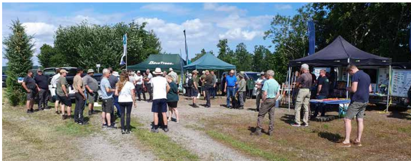
Godt vejr og mange fremmødte ved sorteringsmødet på Falslev i Kronjylland.

En stigende andel af plastiktræer er et stort problem for branchen, da det kan risikere at "lukket hullet" i efterspørgslen, når udbuddet af naturtræer falder. Dermed kan plastiktræerne lægge en dæmper på den forventede prisstigning