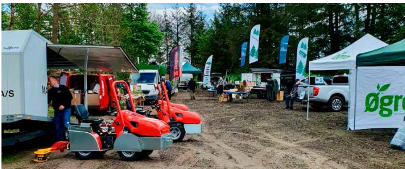
Der var god opbakning til markvandringerne i det nye halvdagskoncept fra både producenter og udstillere. Opstilling på læssepladsen ved Rye Nørskov inden start.

Vejrliget i 2024 var præget af megen nedbør, hvilket udfordrede "vinterarbejdet" med bundklipping og andet arbejde med maskiner i kulturerne. Topskuddenes væksthastighed var meget forskellig, og der blev mange samtaler om strategi og antallet over gennemgange. Nogle blev først færdig med behandling i august afhængig af metodevalg. Den megen fugtighed gav træerne et godt udseende med kraftige skud og fyldige nåle. På de næringsrige jorde observeredes et øget omfang af "røde nåle". Hen i efteråret opstod problemer med farvetab i nogle salgsklare kulturer. Træerne havde ikke haft et optimalt næringsoptag på grund af den meget vandmættede jord i nedbørsrige perioder.